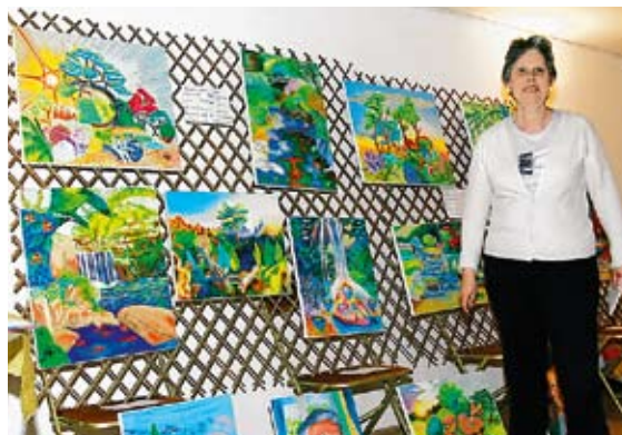
De belles peintures à vendre au bénéfice de l'association