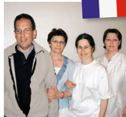
Quelques membres de l'équipe de Hand in Hand France