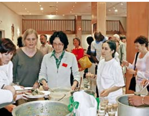
Un déjeuner indien de collecte de fonds organisé à Paris