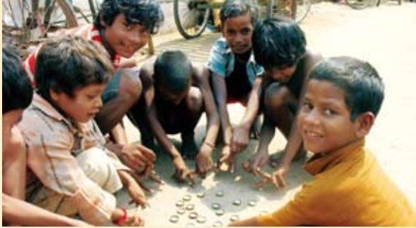
Les enfants des bidonvilles de Cuttack, Mars 2009